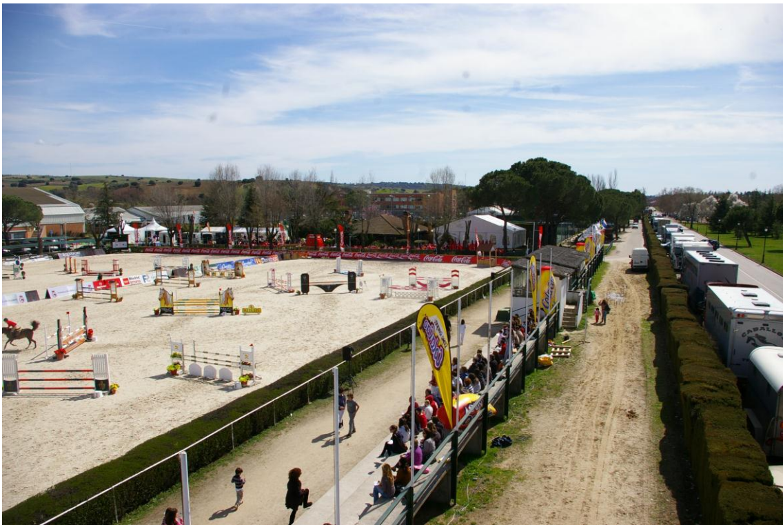
Pista central del UCJC SPORTS CLUB situado en el Campus Universitario de la UCJC en Villafranca del Castillo

La Universidad Camilo Jose Cela y el Consejo Superior de Deportes os dan la bienvenida al III Campeonato de España Universitario de Hípica . La competición se va a celebrar en las instalaciones hípcas del UCJC SPORTS CLUB, ubicado en el Campus de la Universidad Camilo Jose Cela de Villanueva de la Cañada (Madrid).