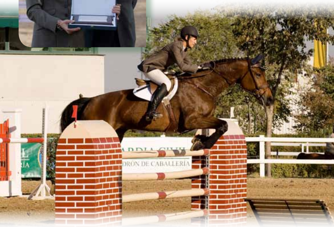
S.A.R. la Infanta Doña Elena de Borbón durante su participación en el XX Campeonato Nacional Militar de Equitación (Valdemoro, Mayo 2010)