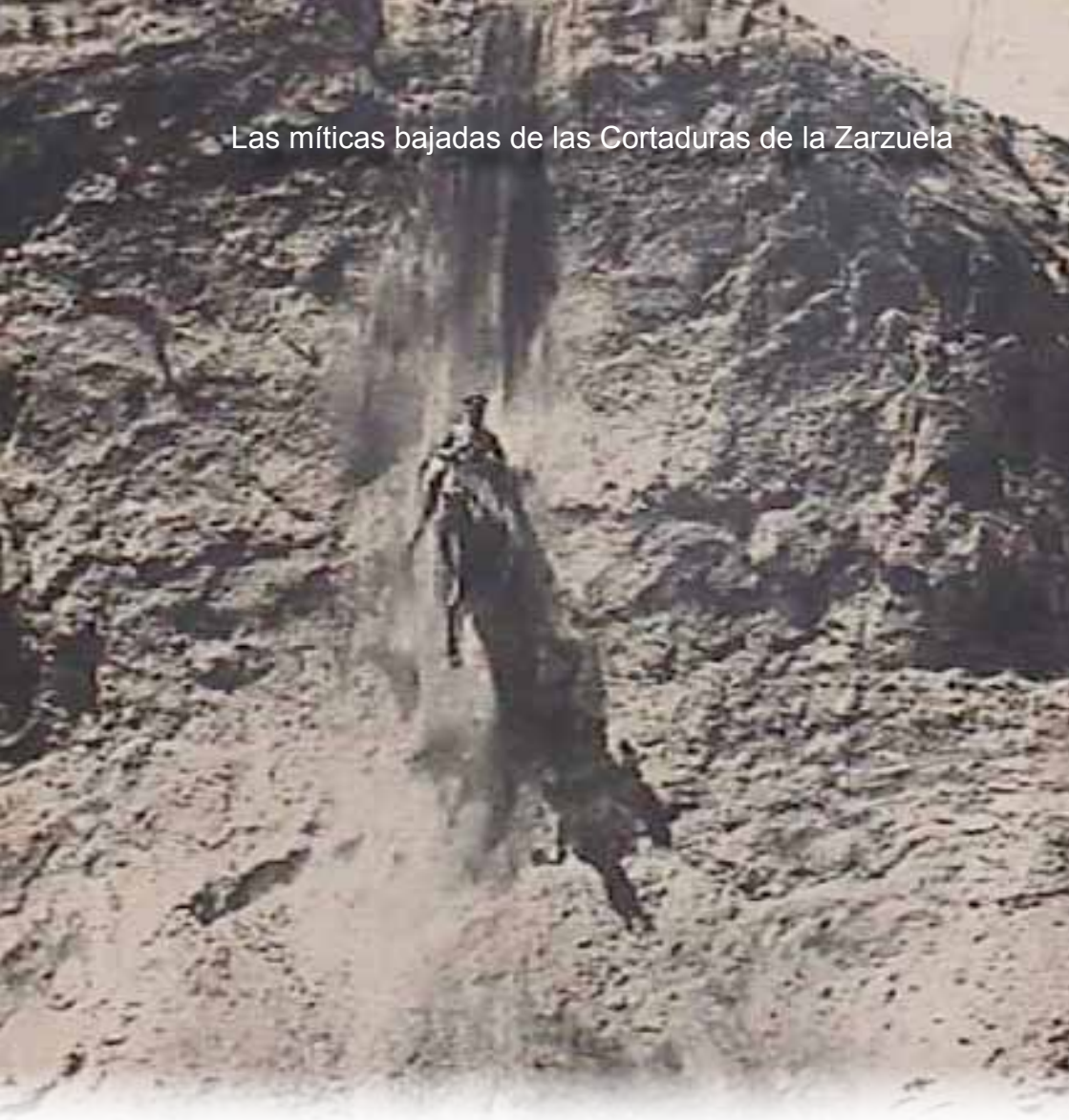
Fotografía del Profesor de exterior de la Escuela de Equitación Militar, Capitán Marqués de los Trujillos.