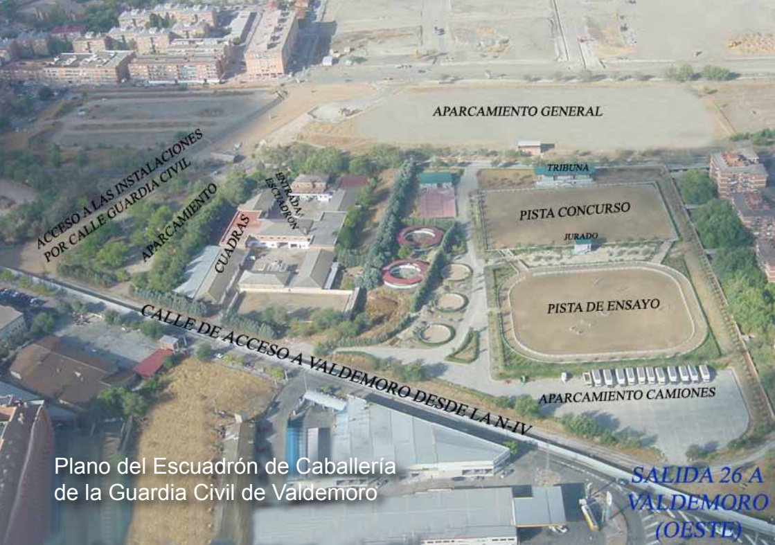
Representación prueba Inter-escuadrones 2010